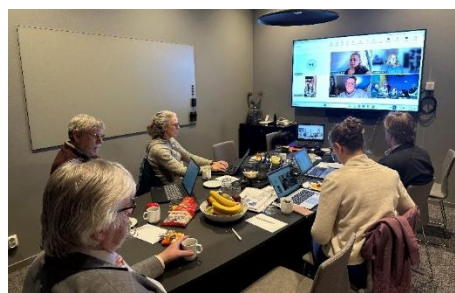
Styrelse och SoMe-gruppen har möte.

För att öka Nordleks synlighet har en grupp tillsatts för att arbeta med sociala medier – SOME-gruppen. Gruppen träffade styrelsen via video under mötet i februari och vi kommer snart se mer av deras arbete på Facebook, Instagram och Tiktok.