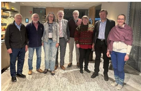
Styrelse och revisorer på möte i Stockholm.

Helgen 20-21 februari möttes styrelsen för Nordlek för möte i Stockholm. Med på mötet var även Nordleks revisorer. Sociala media-gruppen var med på en del av mötet via video.